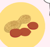
らっかせい (ピーナッツ)