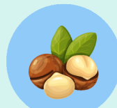
マカダミアナッツ